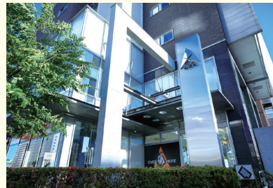
北陸・関西・東海地方に営業所があります

ゲーム機や電気製品、車など身の回りの製品には、さまざまなものづくりの技術がつまっています。こうした製品を作る「ものづくりの会社」をお手伝いするのがエー・オー・シーのお仕事。専門技術を身につけたエンジニアがいろいろな会社にお手伝いにはいり、ものづくりを支えます。